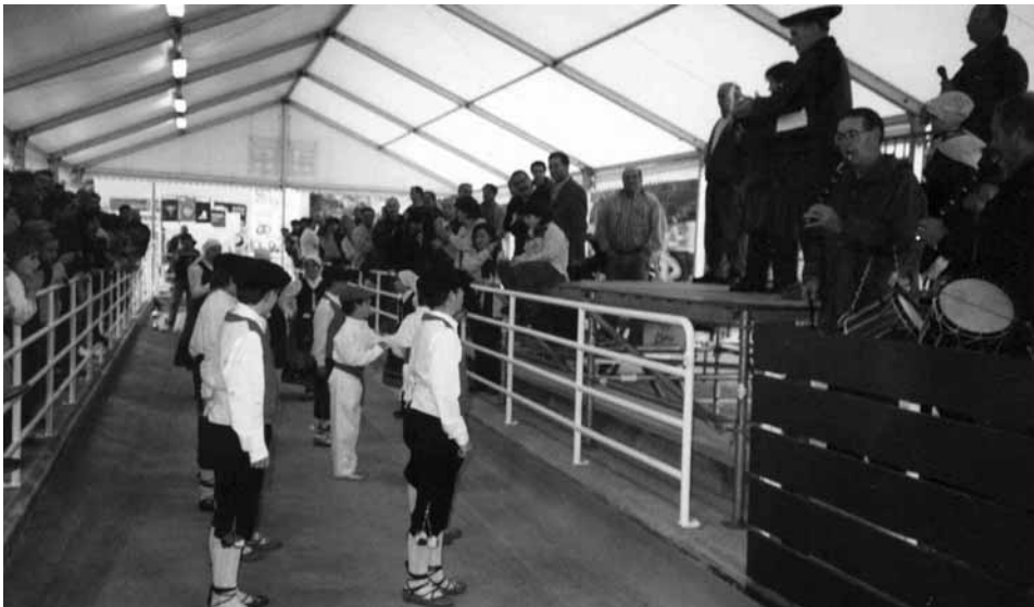
Campeonato de Euskadi 2002. Bolatoki de Herrera

bajo que se realiza. Esto, junto con la capacidad organizativa de Euskal Giroa, hizo posible que el Campeonato de Bolos de Euskal Herria de 2002 se celebrara en el bolatoki de Herrera. Fue organizado conjuntamente por Herrera K. E. y por Euskal Giroa, con un gran éxito logrado a juzgar por la satisfacción manifestada por los bolaris participantes y por la propia Federación.