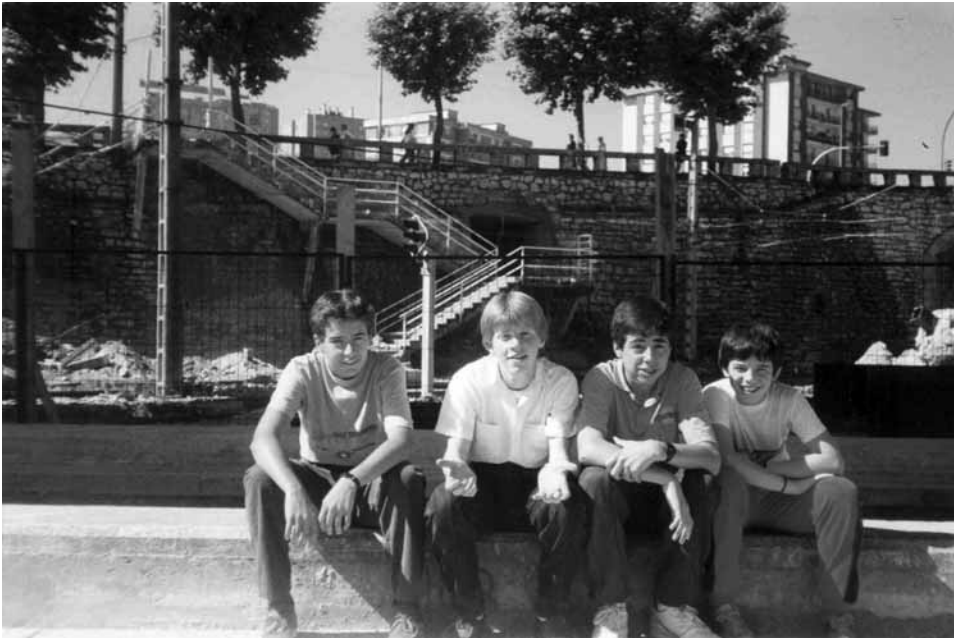
Años 80 - Tirada en el bolatoki ya derribado. Herrera