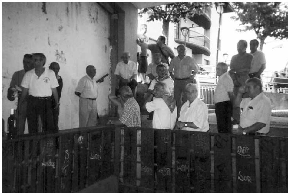
2009 ALTZAKO JAIAK