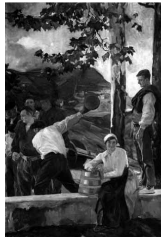
Sorolla, "Guipúzcoa, los bolos"

Al terminar esta crónica tenemos que decir que a muy corto plazo, sólo nos va a quedar el bolatoki de la Plaza de San Martzial. Es necesario que los y las alzatarras hagamos un esfuerzo por mantener lo último que nos va a quedar para preservar no sólo un deporte ancestral sino todo un entramado social de contacto con el resto de Gipuzkoa, con un flujo de desplazamientos siguiendo un calendario federativo y visitas participativas a las fiestas populares de barrios y pueblos como Gabiria, Segura, Hernani, Ereñozu, y tantos otros.