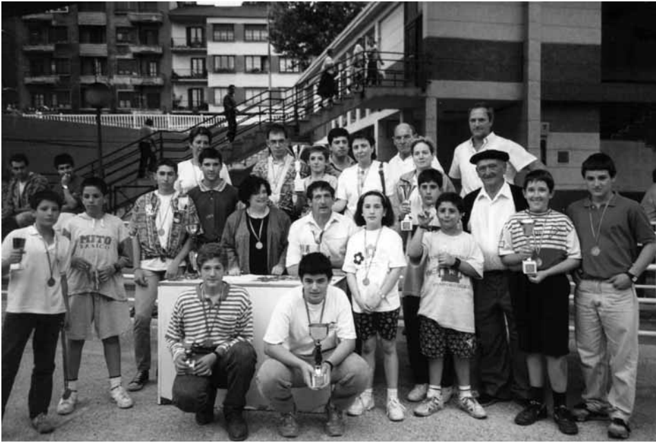
Herrerako jaiak – años 90. Tirada Popular