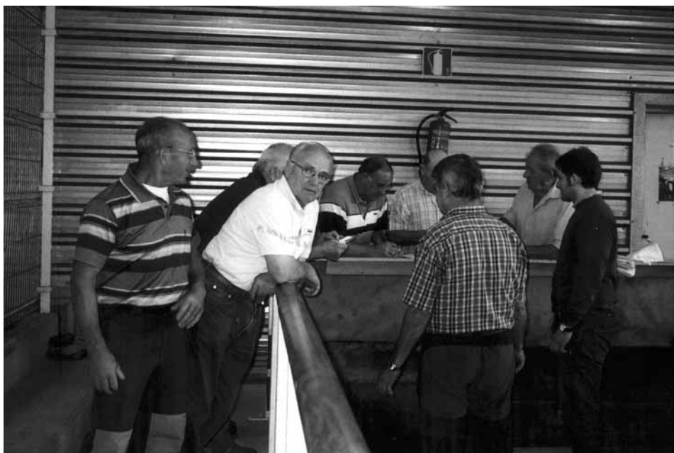
Ultimando las clasificaciones