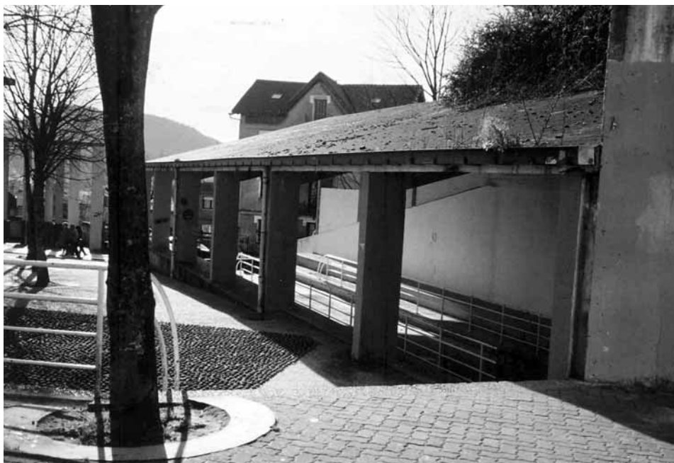
ALTZA GAINA eta HERRERA-ko Bolatokiak