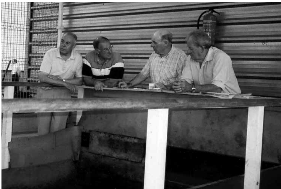
Comprobando inscripciones y tiradas 2009 HERRERAKO JAIK