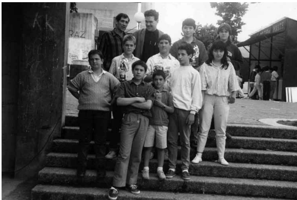
1988 – Tirada Altzako jaiak